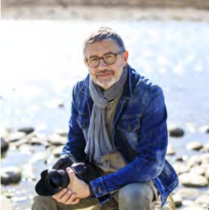
CAMILLE MOIRENC PHOTOGRAPHE