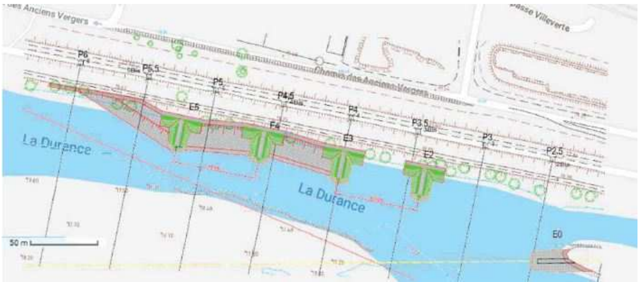
Figure 4: Vue en plan des épis

Par ailleurs, la MRAe relève que l'absence de coupe dans le secteur du raccordement et dans les zones de réfection de berge entre les épis ne permet pas de comprendre pleinement le principe et l'emprise de ces aménagements.