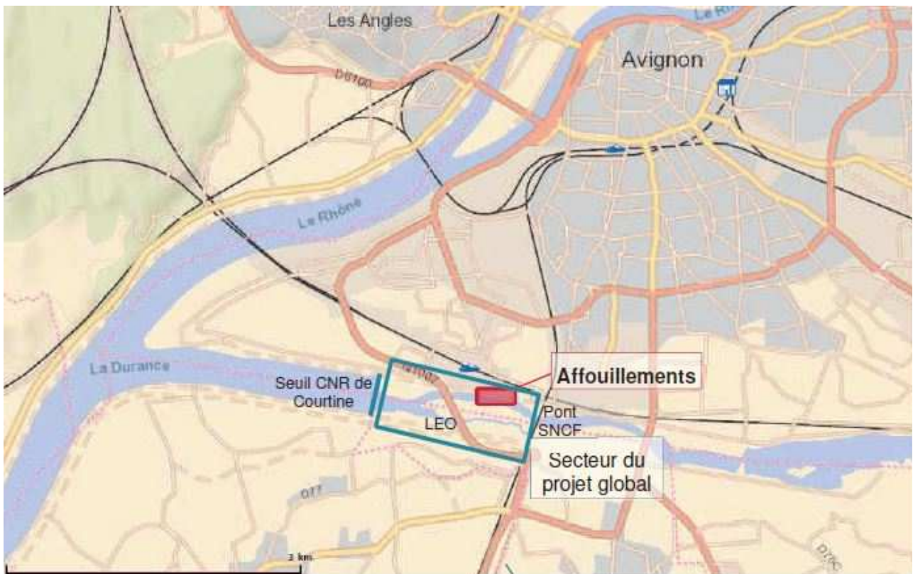
Figure 1: Plan de situation

L'aménagement du barrage de Vallabrègues sur le Rhône aval a impliqué la réalisation de multiples aménagements à l'amont sur le Rhône mais aussi dans le tronçon de la Durance concédé à la CNR en 1970, en particulier :