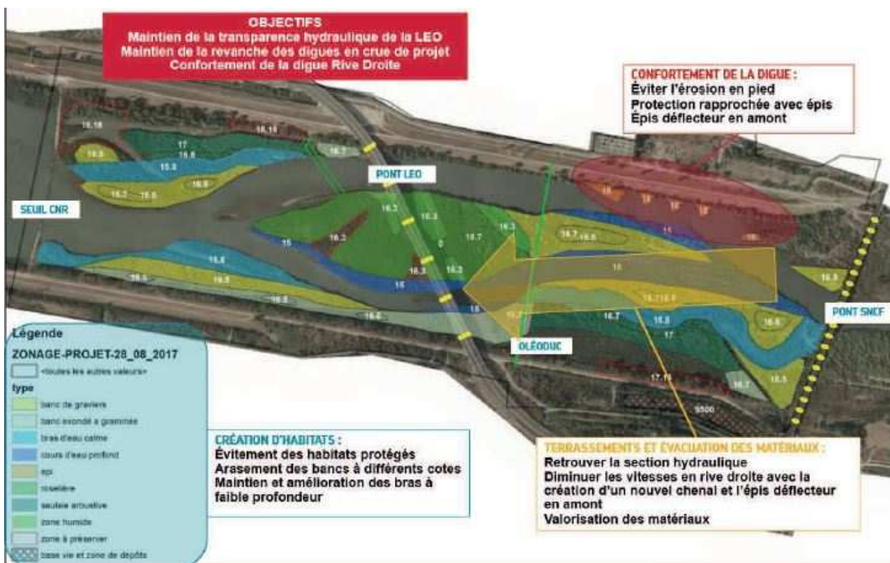
Figure 3: Objectifs du projet global d'entretien