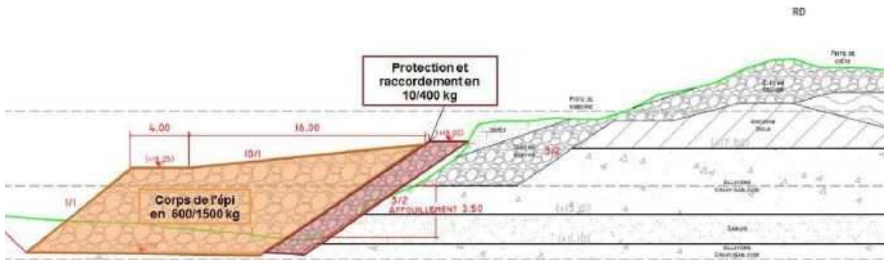
Figure 5: Profil d'épi au droit de la zone d'affouillement

La MRAe recommande de compléter la description du projet notamment dans la zone de raccordement aval et entre les épis.