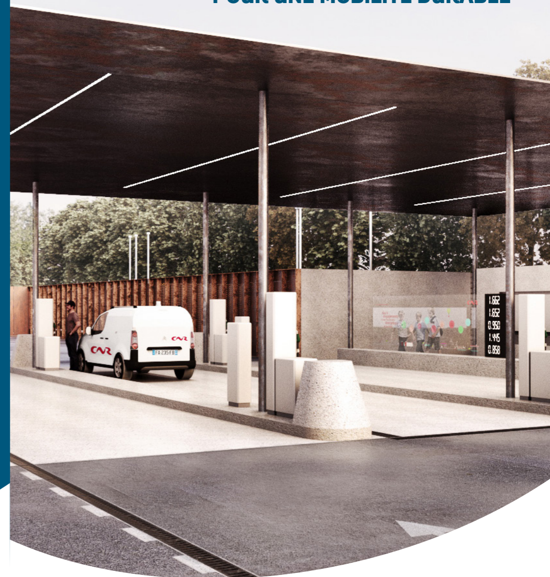
Graphistar 08/2020