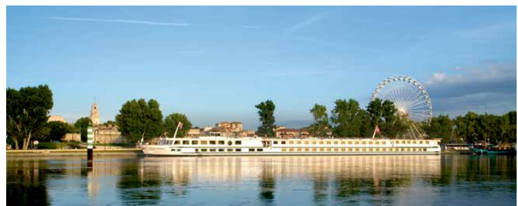
Bateau à passagers à l'accostage devant Avignon