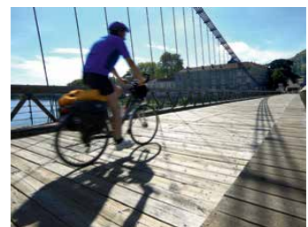
ViaRhôna à Tain-l'Hermitage (Drôme)

+ de 150 km supplémentaires de ViaRhôna réalisés d'ici 2018