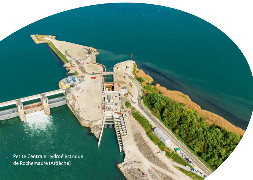
Petite Centrale Hydroélectrique de Rochemaure (Ardèche)

* Calcul basé sur l'index des travaux publics