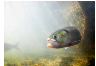
Une alose dans une passe à poissons

Nouer des partenariats avec le monde agricole en faveur d'innovations agro-écologiques économes en eau et des associations engagées en faveur de la survie de l'abeille, insecte pollinisateur indispensable au maintien de la biodiversité.