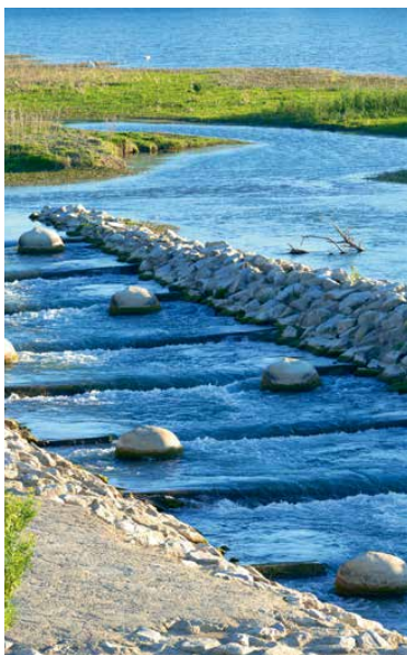
Passe à poissons de Comps (Gard)

Mettre en œuvre le plan de gestion environnemental du domaine concédé dans une logique de conciliation des usages.