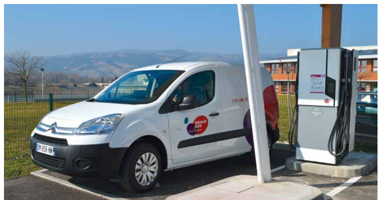
Station de recharge électrique CNR à Bourges-lès-Valence.

La production annuelle de la PCH de Rochemaure (53 GWh) équivaut à la consommation électrique annuelle moyenne d'une commune de 17 000 habitants.