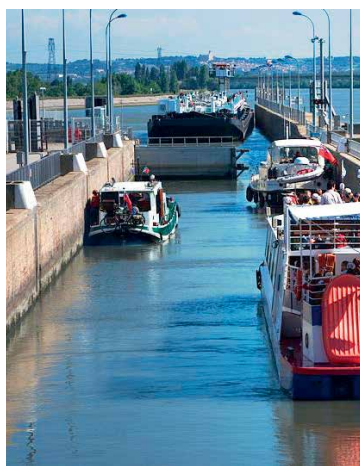
Bateaux passant l'écluse d'Avignon (Vaucluse)

Le transport fluvial représente une solution économique et écologique d'avenir qui répond aux besoins logistiques des entreprises tout en évitant la congestion routière du sillon rhodanien. Par la création d'infrastructures portuaires et la modernisation de celles existantes, la CNR renforce le rôle de l'axe Rhône-Saône comme voie d'échange majeure entre le cœur de l'Europe et la Méditerranée, dynamisant ainsi l'économie de la vallée du Rhône.