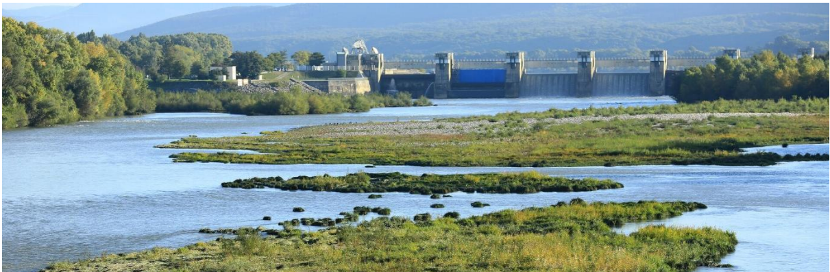
Barrage de Rochemaure sur le Rhône (Ardèche)

Alors que l'épisode de canicule qui touche la France engendre une fréquentation accrue des cours d'eau, CNR déploie sa nouvelle campagne de prévention des risques à proximité des ouvrages hydroélectriques du Rhône. Articulée autour du message « Ouverture du barrage : quand l'eau monte, le danger aussi », elle incite le public à la vigilance et rappelle les bons réflexes à adopter aux abords du fleuve. L'occasion de rappeler qu'été comme hiver, à chaque instant de la journée, le danger est présent, même par beau temps.